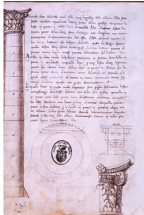
Zichy Codex